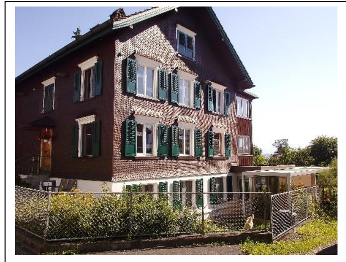
Tagesstättengebäude, das bestehen bleibt