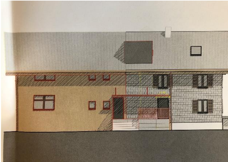
Planskizze, Anbau neu links